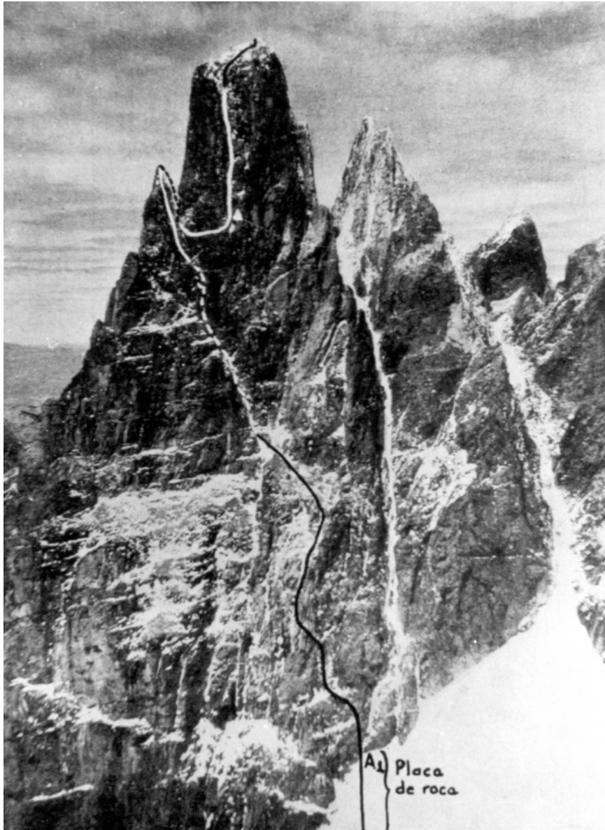
Torre Tuma v pogorju Tres Picos v argentinskih Andih